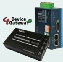
デバイスゲートウェイ® DeviceGateway®

産業用データ連携 プラットフォーム Industrial Communication Platform