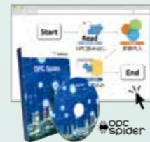
OPC Spider® OPC Spider®

ノーコード対応 システム連携ソフトウェア Data Linkage Software