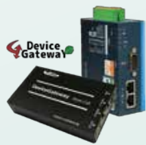
デバイスゲートウェイ® DeviceGateway®

産業用データ連携 プラットフォーム Industrial Communication Platform