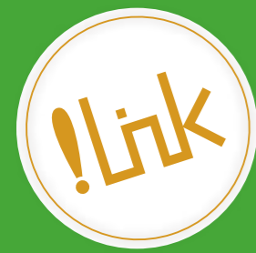
Takebishi Corporate Profile