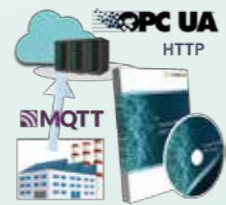
デバイスエクスペローラ® OPCサーバー DeviceXplorer® OPC Server

産業用データ連携 プラットフォーム Industrial Communication Platform