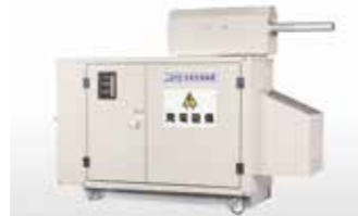
非常用発電機 Emergency Generator