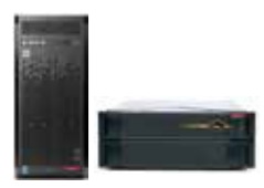
入力業務効率化ツール 「ファイルアーク®」 FileArk®