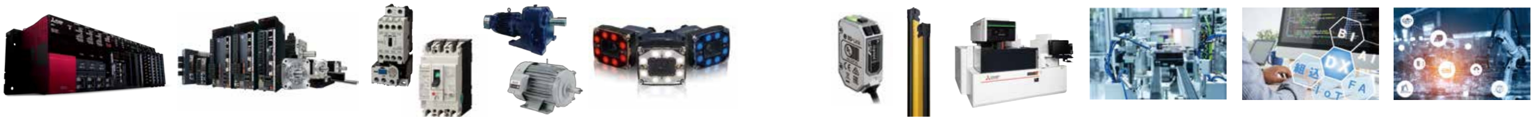
データ活用、AI活用、 スマートファクトリー Data utilization, AI utilization, and Smart-Factory