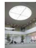
施設照明 Facility lighting