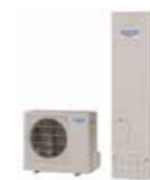
エコキュート Eco Cute