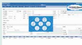
販売管理パッケージ「TECSAS」 Sales Management System [TECSAS]