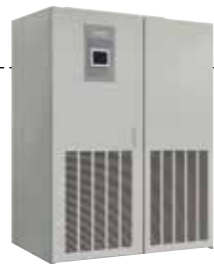
無停電電源装置 Uninterruptible Power Supply