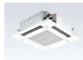
空調機 Air Conditioner