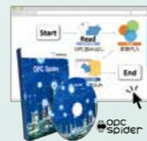
OPC Spider® OPC Spider®

ノーコード対応 システム連携ソフトウェア Data Linkage Software