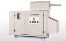
非常用発電機 Emergency Generator