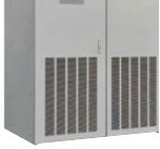
無停電電源装置 Uninterruptible Power Supply