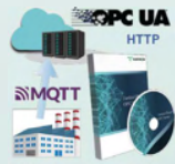
デバイスエクスプローラ OPCサーバー DeviceXPlorer OPC Server

産業用データ連携 プラットフォーム Industrial Communication Platform