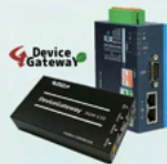
デバイスゲートウェイ DeviceGateway

産業用データ連携 プラットフォーム Industrial Communication Platform