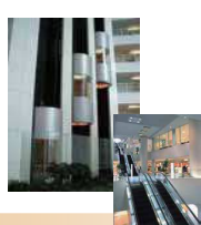
エスカレーター / エレベーター Escalators/Elevator