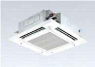
空調機 Air Conditioner