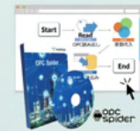
OPC Spider OPC Spider

ノーコード対応 システム連携ソフトウェア Data Linkage Software