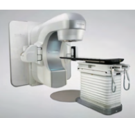
放射線治療装置 Equipment for Radiation Therapy